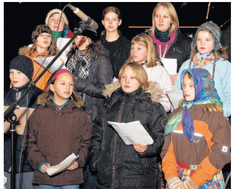
Der Chor erhielt für seinen Auftritt in Rodau viel Beifall.

Bei bunten Lichtern, Lagerfeuer und Stockbrot, Kürbissuppe und Glühwein und weihnachtlicher Stimmung saßen viele Menschen noch lange Zeit beieinander und freuten sich über die Möglichkeit dieser Waldweihnacht in Rodau, der glücklicherweise sogar das Wetter mit angenehmen Temperaturen wohlgesonnen war.