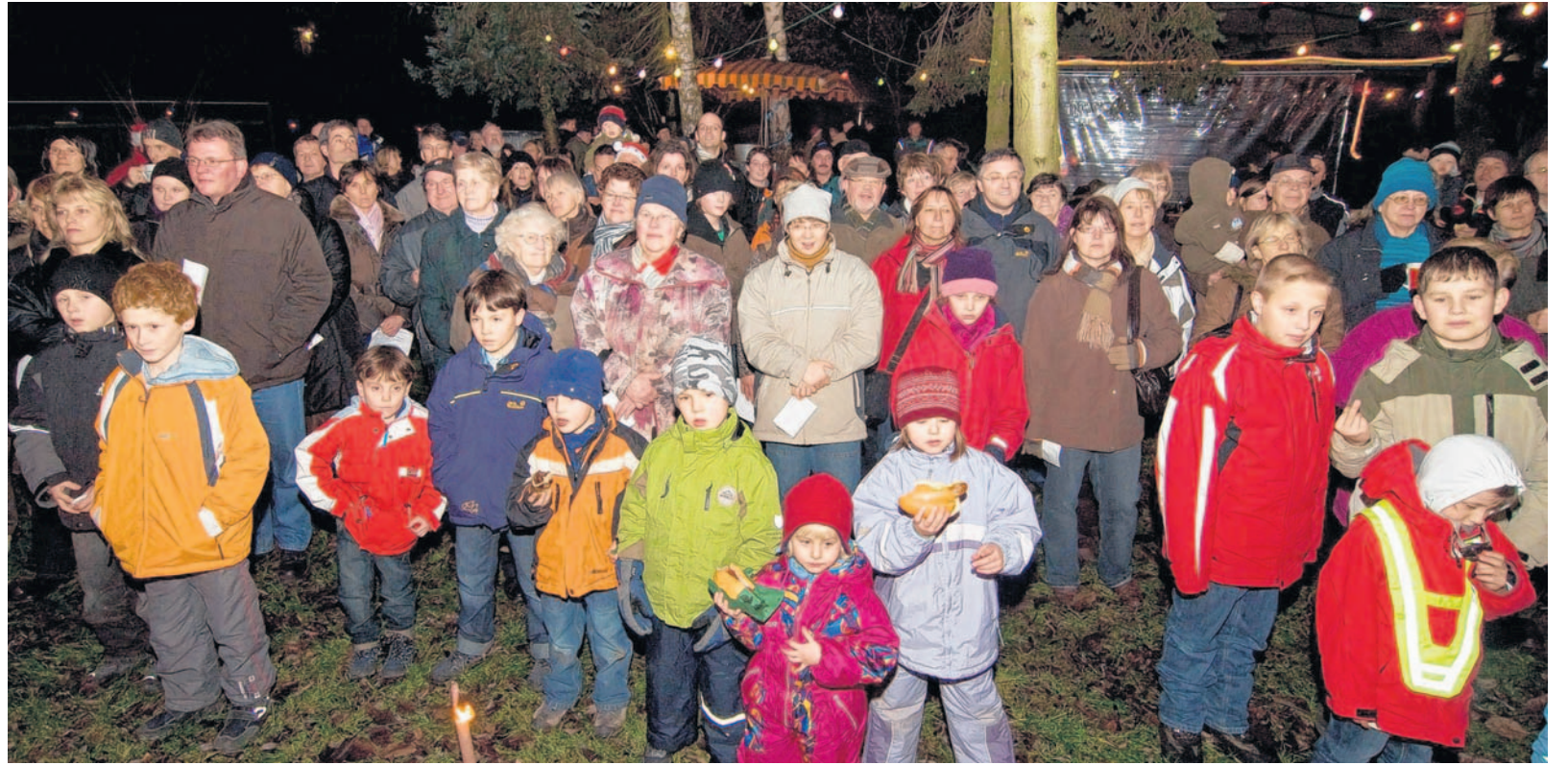
Die stimmungsvolle Waldweihnacht in Rodau zog viel Publikum an. Zu erleben gab es ein Singspiel um den armen Schuster Martin, der in seiner eigenen Not es aber dennoch nicht vergisst, auch anderen zu helfen.

So erinnerte sich beispielsweise der Straßenkehrer bei Martin wieder